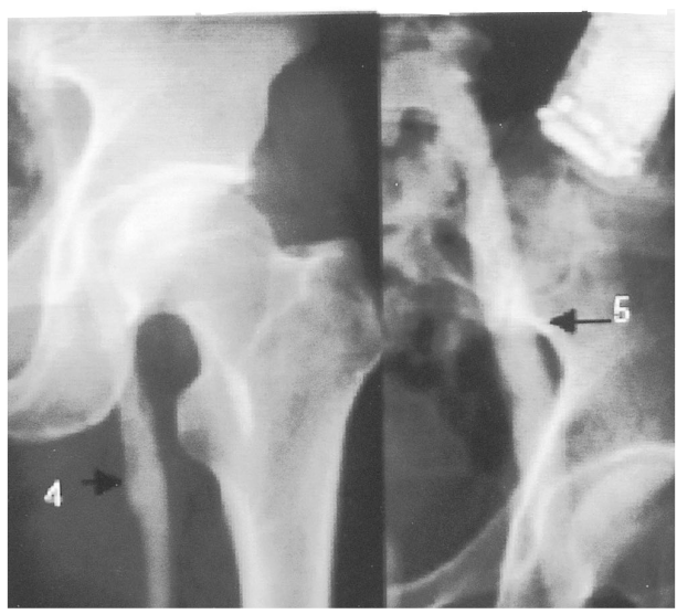
圖二:靜脈血管攝影發現在深層及淺層靜脈並無阻塞 1:前脛靜脈 ( anterior tibial vein ), 2:腓靜脈 (peroneal vein ), 3:膕靜脈 ( popliteal vein ), 4:深股靜脈 ( deep femoral vein ), 5: 骼股靜脈 (iliofemoral vein)

學檢查有水腫、皮膚變紅及小腿壓迫時會有疼痛,然而靜脈血管攝影在深層及淺層靜脈並無阻塞。(圖二)根據 Villita 評分屬於輕微至中度栓塞後症候群。此後病人在門診追蹤時,其症狀一直持續,尤其在整天工作結束後,症狀會加劇,病人因此向工作單位申請留職停薪。